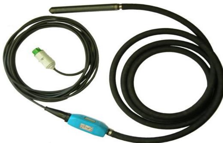
Рисунок 1. Вибраторы электрические глубинные ручные со встроенным электродвигателем ИВАР-38, ИВАР-50, ИВАР-60, ИВАР-75.