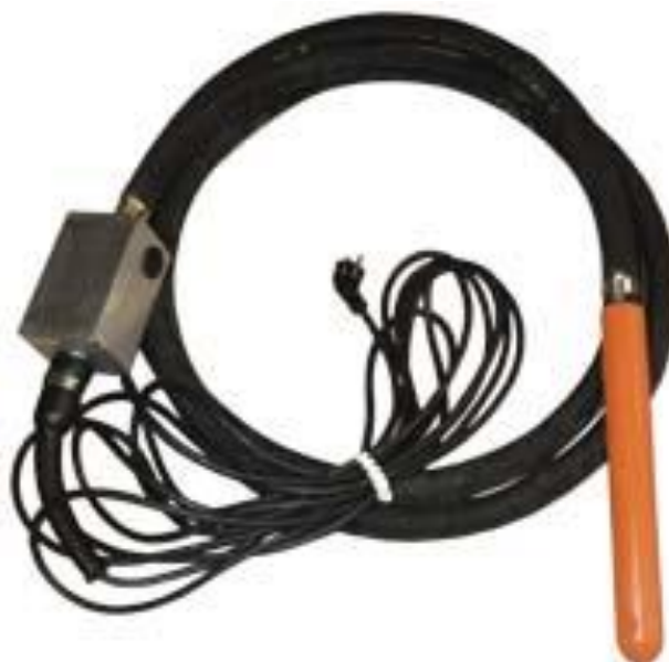
Рисунок 2. Вибратор электрический глубинный ручной со встроенным электродвигателем и встроенным инвертором, однофазные ИВАИ-38, ИВАИ-50, ИВАИ-60, ИВАИ-75.

ВНИМАНИЕ! В связи с проводимыми работами по совершенствованию конструкции и технологии изготовления, возможны некоторые расхождения между описанием и поставляемым изделием, не влияющие на его техническую характеристику и техническое обслуживание.